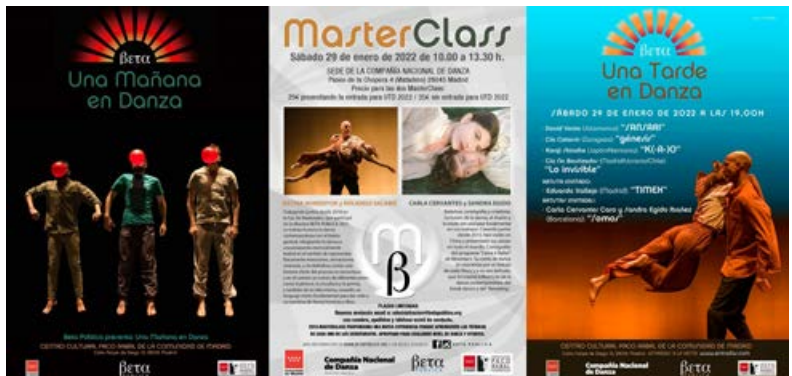
Carteles UMD y UTD 2022

La Asociación desarrolla, además de la Muestra, programas como UNA MAÑANA EN DANZA (UMD), programa de actividades extraescolares, dirigido a colegios de la Comunidad de Madrid, cuyo objetivo es educar a las audiencias del futuro y al que han asistido, desde su primera edición en febrero 2015, más de 18.000 alumnos y profesores. UNA TARDE EN DANZA es el programa gemelo que extiende la experiencia de UMD al público en general.